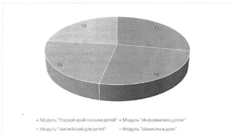
Рис. 2. Количество педагогов, реализующих дополнительную общеобразовательную программу по социально-коммуникативному и познавательному развитию «Современные дети»

Количество штатных единиц педагогов дополнительного образования, необходимых для реализации Программы, составило в этом году 30.