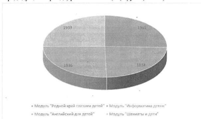
Рис. 1. Количество детей, принимающих участие в Модулях Программы

- в модуле «Шахматы и дети» участвуют 1933 (на 589 участников больше, чем в предыдущем периоде) ребёнка из 90 (59) групп (35 ОО).